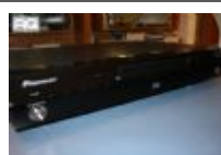
Varie Pioneer BDP-LX 52 € 300,00